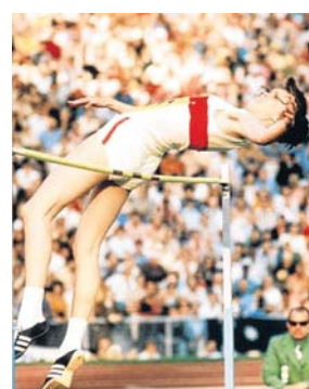
Rekordsprung: Ulrike Meyfarth, 16, bei Olympia 1972.

Olympiastadion, 4. September 1972. Eine schlaksige Schülerin steht bereit für ihren letzten Versuch über 1,92 Meter, es ist das olympische Hochsprung-Finale. Im Stadion herrscht gespannte Stille. Ulrike Meyfarth läuft an – und bewältigt die Höhe. Jubel brandet auf, Weltrekord eingestellt. Gold hatte der 1,85 Meter große Teenager schon vorher in der Tasche. Jetzt geht die 16-Jährige in die Geschichte ein, als jüngste Hochsprung-Olympiasiegerin aller Zeiten. Bald könnte es wieder historisch zugehen im Olympiapark – sollte es gelingen, die Winterspiele 2018 nach München zu holen.